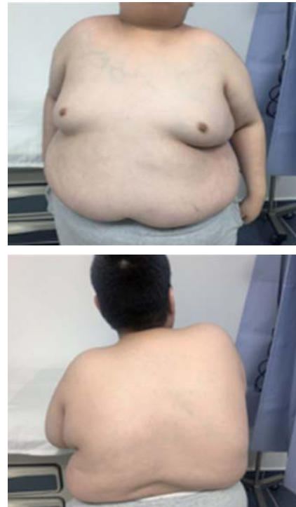
Figura 1. Paciente masculino de 17 años de edad con diagnóstico clínico de SPW, con 9,5 puntos de acuerdo con los criterios de Holm (1993), con estudio FISH positivo a deleción 15q11-q13. En la actualidad, lleva un mal control en la dieta, con un IMC de 45 kg/m 2 . Muestra el hábito corporal típico del síndrome de Prader-Willi (SPW), con grasa distribuida principalmente en abdomen, caderas y muslos; escoliosis marcada.

La estrategia diagnóstica en lo referente al estudio genético de los pacientes con sospecha clínica de SPW ( Figura 1 ) se basará en establecer un cariotipo y un estudio de metilación como prueba inicial de cri-